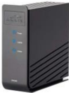
Arris CATV Modem